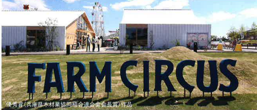
優秀賞(兵庫県木材業協同組合連合会会長賞)作品