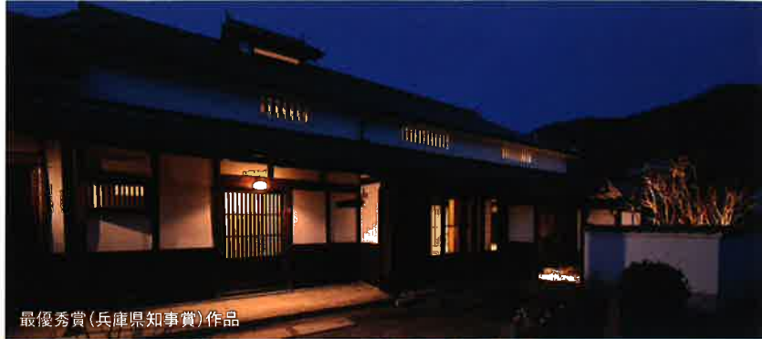
最優秀賞(兵庫県知事賞)作品

居住性やデザイン性に優れた作品はもとより、木材の良さの再発見や利用用途の拡大につながるクリエイティブな作品のご応募をお待ちしております。