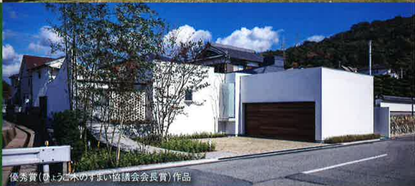
優秀賞(ひょうご木のすまい協議会会長賞)作品